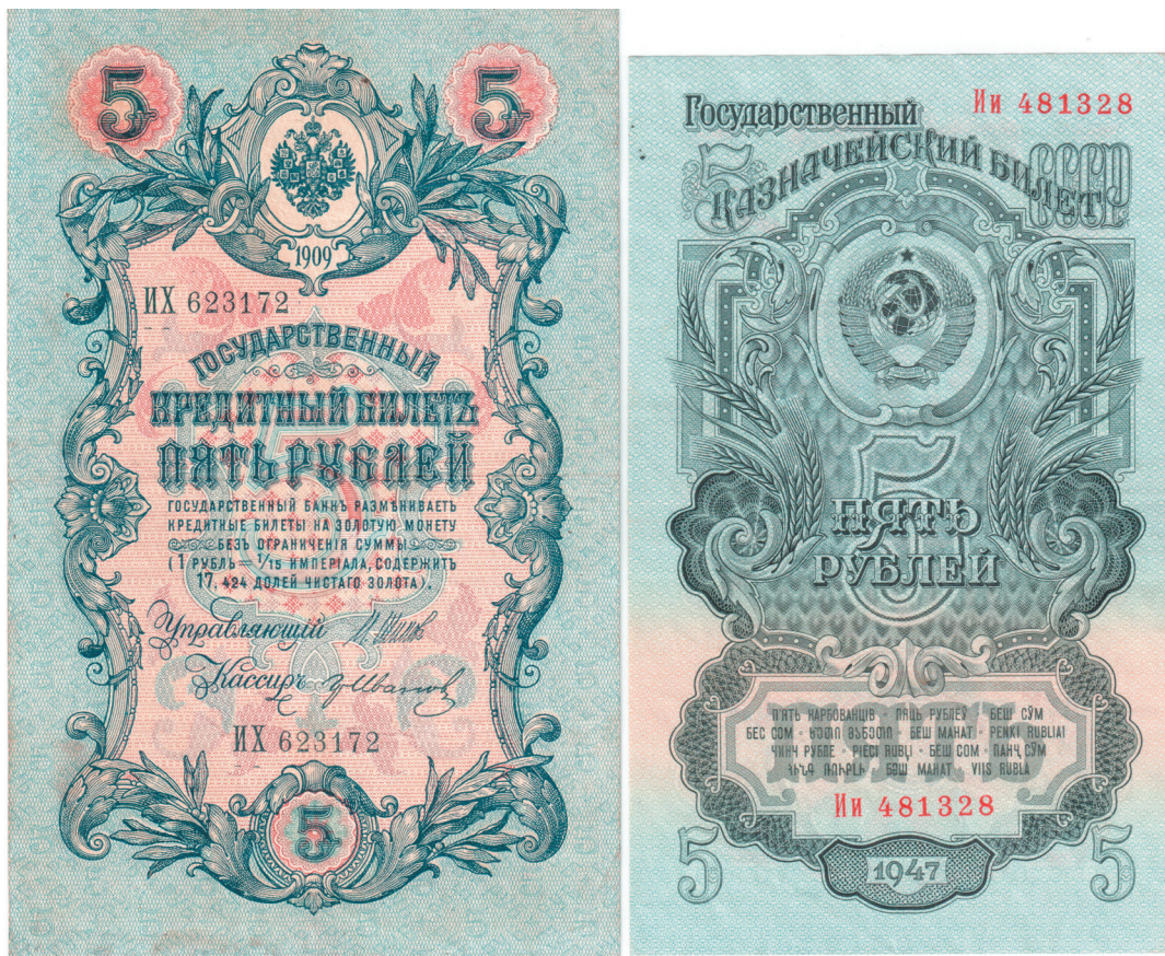
Денежные знаки образца 1909 и 1947 гг.

ка А. Р. Эберлинга, выполненный гравером С. И. Аферовым по фотографии П. Оцуца. На водяном знаке билетов в 50 и 100 руб. также располагался «эберлинговский» Ленин. Эскиз 5-рублевой банкноты, которая сильно напоминала купюру выпуска 1909 г., задал тон в создании всей серии денег образца 1947 г., стиль которой принято называть «советским имперским стилем» 10 .