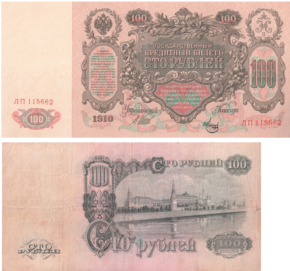
Денежные знаки образца 1910 и 1947 гг.

Со второго полугодия 1946 г. в соответствии с постановлением Совета Министров на Ленинградской бумажной фабрике начались работы по изготовлению спецбумаги «АНОЛ» (водяной знак — портрет В. И. Ленина) и «АНОЗ» (водяной знак — звезды). Бумажная машина для отлива бумаги «с локальным знаком “АНОЛ”» была пущена в эксплуатацию 9 июля 1946 г., а вторая машина — 15 октября. Именно в Ленинграде впервые в стране был освоен выпуск бумаги с локальным водяным знаком (несколько партий такой бумаги изготовили и на Краснокамской фабрике).