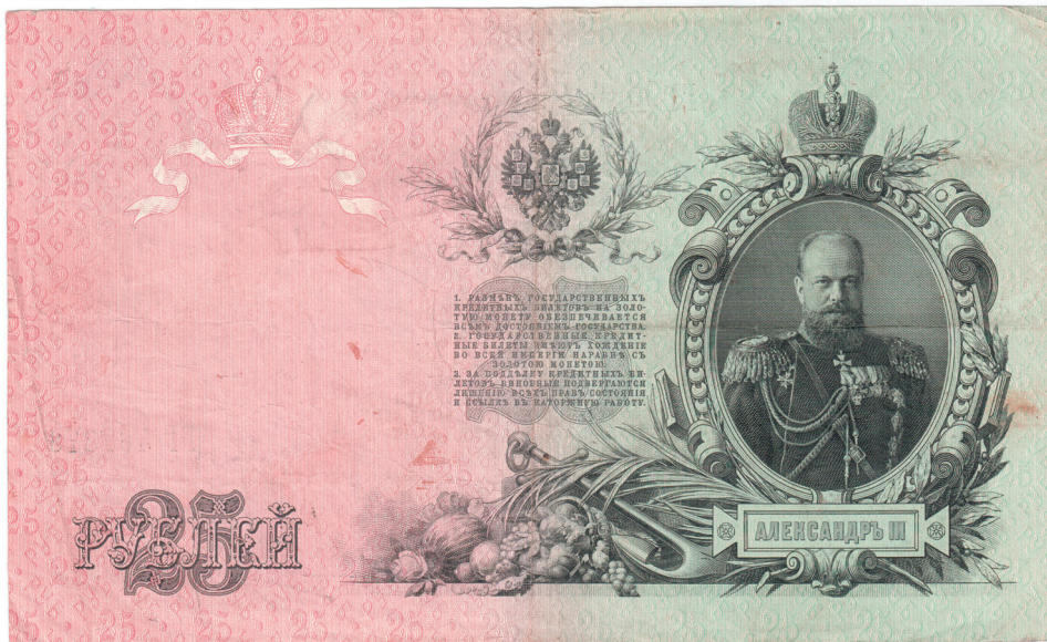
Денежные знаки образца 1909 и 1947 гг.

ком реконструкция бумагоделательных машин (из длинносеточных в цилиндрические) позволила значительно ускорить производство банкнот 18 .