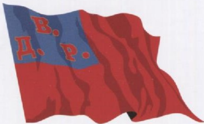
Флаг Дальневосточной Республики