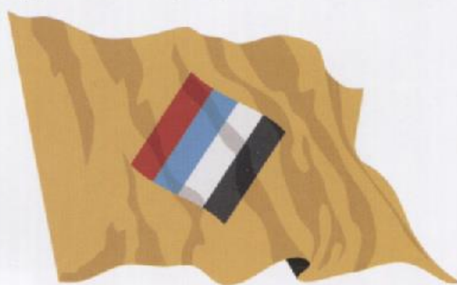
Флаг Маньчжурии с 1922 г.