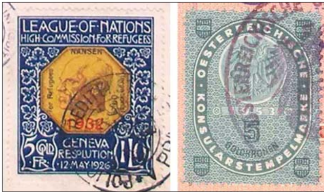
Особые денежные единицы в консульских марках: золотой франк на марке для паспортов “Нансена” для эмигрантов из России и турецкой Армении (1926 г.), золотая корона на австрийской консульской марке (1953 г.).

7. Выдача карточек на продовольственные продукты. В истории всех государств были тяжелые периоды, когда применялась карточная система. В каждой стране вводились особые системы учета выдачи карточек на продукты, табачные или другие изделия для своих граждан или иностранцев, постоянно проживающих в таком государстве. Но другие способы учета выдачи карточек применялись в случаях, когда иностранцы посещали страну только на несколько дней: выдача карточек записывалась в паспорта. Данные записи можно найти в паспортах людей, которые во второй половине 1940-х гг. посещали Чехословакию, Швейцарию и Швецию.