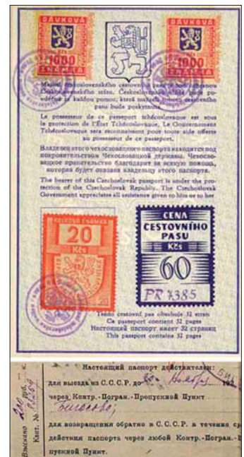
Выдача чехословацкого (1949 г.) и советского (1928 г.) заграничных паспортов.

6. Курьезные платы. Они связаны с переходом границы и выдачей паспортов, их можно найти в старых паспортах. Так, в российском паспорте 1909 г. такая плата составила 5 руб. — в пользу Российского Общества Красного Креста: “взыскана и вклеена в Астраханское Казначейство 11 августа 1909 г. под квитанцию 30 № 26413”. Еще один пример: запись в австрийском паспорте о штрафе 102 кроны, которые владелец заплатил за уклонение от чехословацкого таможенного контроля на пограничном пункте Бржецлав.