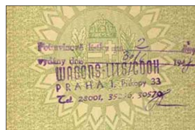
Запись в словацком заграничном паспорте (1940 г.) о высылке словацкого гражданина на работу в Германию.

Перечисленные примеры показывают широкое разнообразие возможностей, как с помощью удостоверений личности, паспортов можно проиллюстрировать разные аспекты истории денег отдельных стран. Естественно, в рамках более подробного материала можно было бы выявить и иные стороны, специфические для конкретного государства или эпохи.