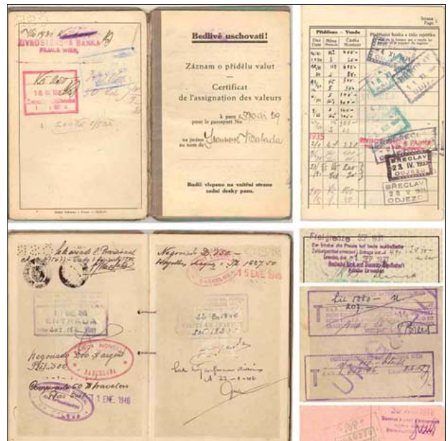
“Валютная” книжка в чехословацком заграничном паспорте (1930 г.), запись об обмене валюты в германском паспорте (1937 г.), записи испанских таможенников о перевозке валюты в чехословацком заграничном паспорте (1946 г.), две формы записей об обмене валюты в австрийском паспорте (1950-е гг.), запись в советском паспорте (1976 г.).

Гражданам Чехословакии разрешалось обменивать или вывезти эквивалент 1000 крон в месяц (примерно 1-1,5 зарплаты того времени). Книжки, сохранившиеся в большом количестве, показывают, что большинство их владельцев не ездили за границу более 6 раз в течение 5 или 10 лет действия паспорта. Часто деньги