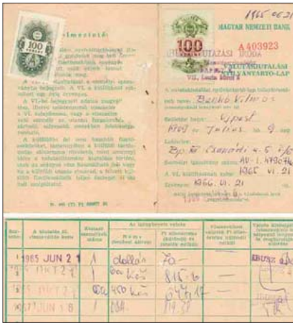
Венгерская валютная книжка с записями об обмене (вторая половина 1960-х гг.).

зации отношений между ГДР и ФРГ в 1970-х гг. При каждой поездке они имели право на обмен 15 западных марок. Обмен записывался с помощью печати с текстом: “DM 15, — выдано Государственный банк Германской демократической республики, Районный филиал Биттерфельд”.