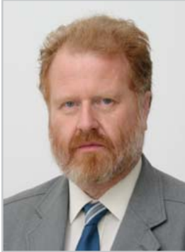
Президент Словацкого нумизматического общества при Словацкой Академии наук

В изучении истории денег можно пользоваться документами разнообразного характера и происхождения. Самое большое значение имеют документы, напрямую связанные с подготовкой, осуществлением и ходом разных процессов, записи (заметки) в хрониках и воспоминания участников событий. Но в определенной степени можно пользоваться и документами, которые, на первый взгляд, не имеют никакого отношения к конкретной проблеме. К ним относятся: удостоверения личности, заграничные и внутренние паспорта, часто содержащие много пометок о хозяйственно-юридических или денежных сделках, мероприятиях и административных правилах для населения или отдельных слоев общества. Пометки в заграничных паспортах показывают ограничения, с какими частные лица сталкивались при распоряжении своими деньгами. Особая ценность удостоверений личности — в их соотношении с конкретным лицом, его общественным положением и судьбой.