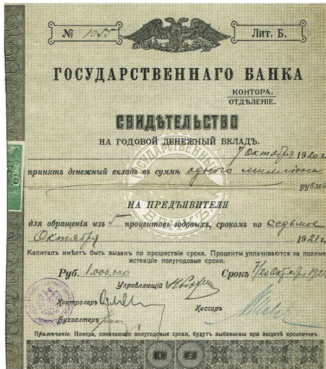
Госбанк, Севастопольское отделение. Свидетельство на годовой денежный вклад в сумме один миллион рублей, №1055. Судя по всему такие свидетельства 1920 года были выданы владельцам 6% краткосрочных обязательств ГК ВСЮР номиналом 100.000 рублей, срок которых заканчивался в августе и ноябре. Ввиду инфляции сумма увеличивалась в 10 раз

Всего набралось 50 эмитентов. Ничего удивительного в этом конечно нет: тяжелые годы Гражданской войны не способствовали деловой активности российских предпринимателей. Следует также иметь в виду, что в центральных областях, контролируемых большевиками, произошла полная национализация экономики и все операции с ценными бумагами были запрещены. Тем не менее я полагаю, что малоизученный в скрипофилии период Гражданской войны содержит большее количество артефактов. Основанием для этого служит то обстоятельство, что в последние годы на аукционах постоянно всплывают ранее неизвестные ценные бумаги, в том числе периода 1918-1920 гг.