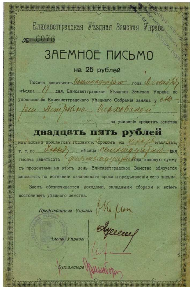
Елисаветградская уездная земская управа. Заёмное письмо на 25р, №6076. Рукописные подписи председателя и членов управы