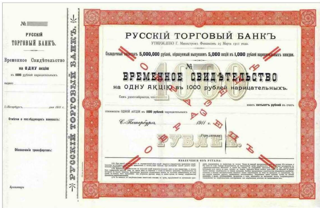
Русский торговый банк. Временное свидетельство, образец, 1911г.

Перед нами образец временного свидетельства 1911 года, дающий право на получение одной акции коммерческого банка. Он содержит обычные для такого финансового документа сведения: складочный капитал, дату утверждения устава (25 марта), номинал акции и т.д. Есть только одна странность: акционерного банка с таким названием - РУССКИЙ ТОРГОВЫЙ БАНК - в дореволюционной России никогда не существовало. Полный перечень акционерных коммерческих банков есть например в [1]. Их не так много - на 1 января 1914 года около сорока. Объяснение данной несуразности может быть простое: по каким-то причинам банк так и не начал функционировать, а приведенный образец ценной бумаги - его единственный «след в истории».