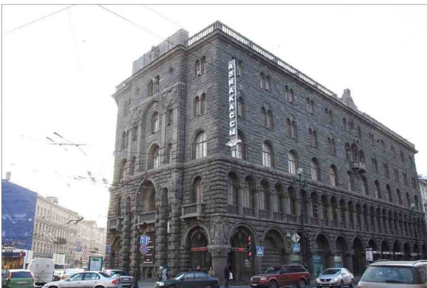
Невский проспект, дома 7-9. «Дом Вавельберга».

Нас естественно интересуют коммерческие банки, для которых в типографии Шумахера изготавливали образцы учредительских и временных свидетельств, а также другие документы. Среди них нам известны следующие: Нижегородский Купеческий Банк, Юрьевский банк, Учетно-ссудный банк Персии, Коммерческий банк Юнкер и К, С.-Петербургско-Московский коммерческий банк, Одесский купеческий банк, С.-Петербургский частный коммерческий банк, С.-Петербургский учетный и ссудный банк, банк Вавельберга. Два банка в этом списке не являлись акционерными. Учетно-ссудный банк Персии был основан Я.С.Поляковым в 1890 году и вскоре стал фактически филиалом Государственного банка. Банкирский дом Вавельберга, основанный еще в 1848 году, акционировался в 1911 году, получив при этом новое название, которое сразу привлекает наше внимание: С.-Петербургский торговый банк . Очевидно, что название очень похоже, заменено только первое сло-