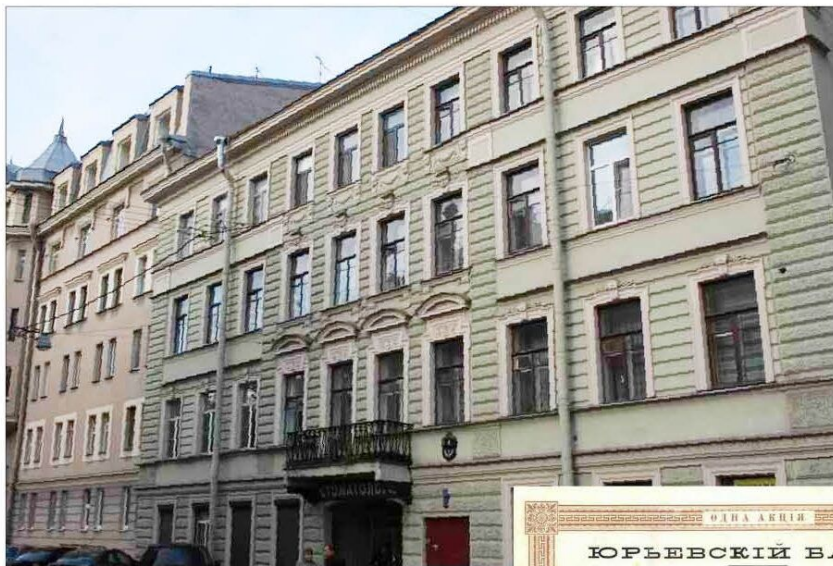
Тучков переулок, д. 1. В этом здании находилась типография Шумахера.

во. Дата утверждения устава также близка – 15 декабря 1911 года. Видимо по случаю акционирования для банка было построено в 1912 году новое помещение – знаменитый «дом Вавельберга» на углу Невского про-