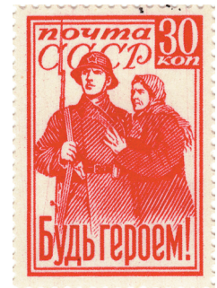
Илл. 8. Почтовая марка СССР достоинством 30 копеек «Будь героем!» — первая марка, выпущенная во время Великой Отечественной войны. 1941 г.