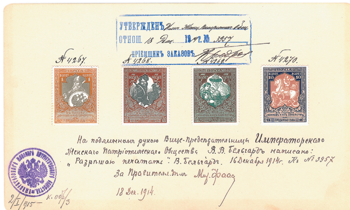
Илл. 2. Утверждённые образцы почтово-благотворительных марок «В пользу воинов и их семейств». 1914 г.