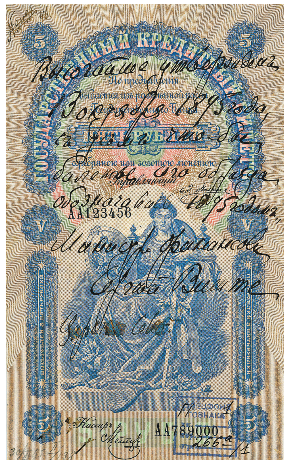
Илл. 3. Государственный кредитный билет достоинством 5 рублей образца 1895 г. Образец, утверждённый министром финансов Российской империи С. Ю. Витте. 1895 г.