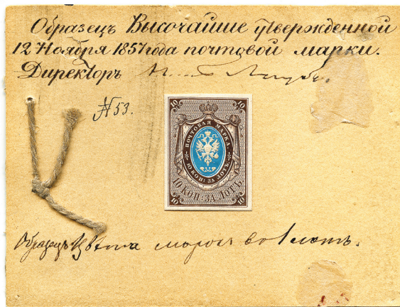
Илл. 1. Образец первой общероссийской почтовой марки, утверждённый директором Почтового департамента Н. И. Лаубе. 1857 г.

Монет и банкнот на выставке немного – они служат лишь дополнением к основной экспозиции. Однако здесь впервые выставлены уникальные образ-