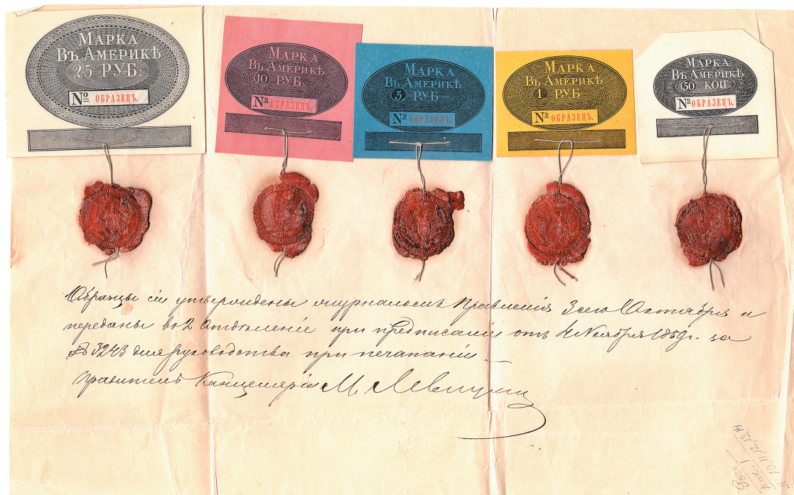
Илл. 11. Платёжные марки Российско-Американской компании. Образцы. После 1859 г.