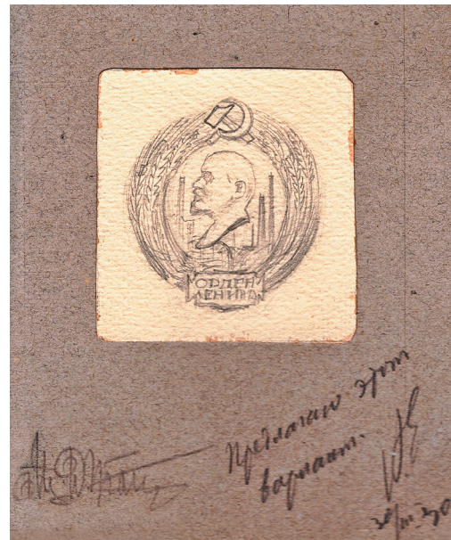
Илл. 5. И. И. Дубасов. Проектные рисунки ордена Ленина, один из которых утверждён секретарём ЦИК СССР А. С. Енукидзе. 1930 г.