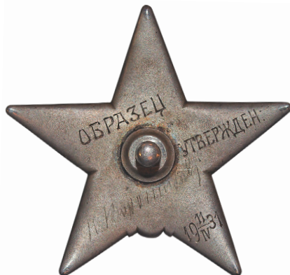
Илл. 16. Орден Красной Звезды. Образец, утверждённый народным комиссаром по военным и морским делам СССР К. Е. Ворошиловым. 1931 г.