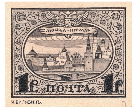
Илл. 10. И. Я. Билибин. Проектный рисунок почтовой марки, посвящённой 300-летию Дома Романовых. 1910 г.