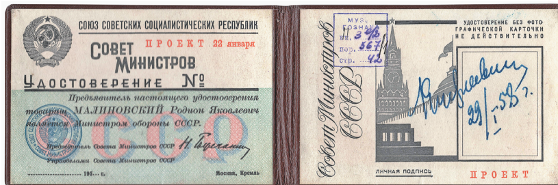
Илл. 6. Удостоверение министра обороны СССР маршала Р. Я. Малиновского. Образец. 1958 г.