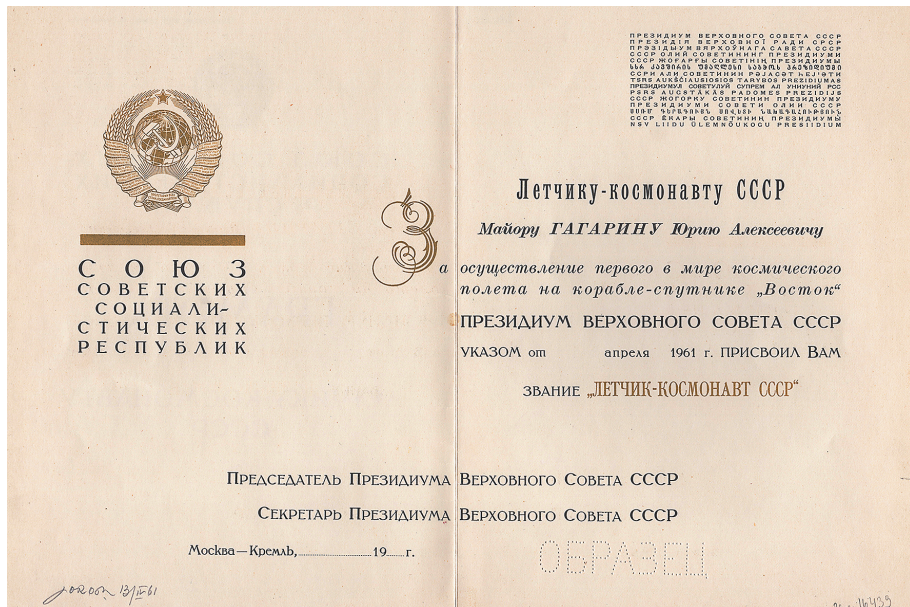
Илл. 14. Грамота лётчика-космонавта СССР, изготовленная для Ю. А. Гагарина. Образец. 1961 г.