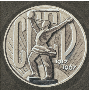
Илл. 4. В. А. Ермаков. Проектные рисунки неутверждённых памятных монет, посвящённых 50-летию советской власти. 1966 – 1967 гг.