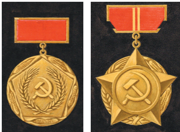
Илл. 12. Проектные рисунки неутверждённых медалей к «Золотой Книге Почёта Верховного Совета СССР». 1963 г.