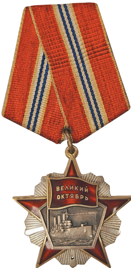
Илл. 15. Неутверждённый вариант ордена к 50-летию советской власти, выполненный по рисунку В. П. Зайцева. 1967 г.