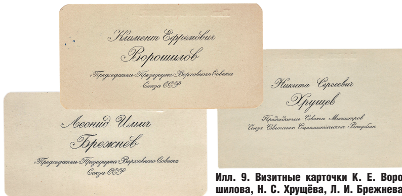
Илл. 9. Визитные карточки К. Е. Ворошилова, Н. С. Хрущёва, Л. И. Брежнева. Образцы. 1958 – 1960 гг.