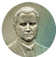
Международная премия имени академика В.П. Глушко «За пропаганду науки в литературе»