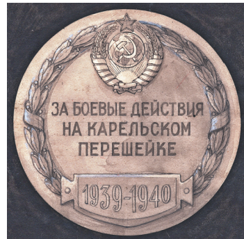
Илл. 13. Эскизы неутверждённой медали «За боевые действия на Карельском перешейке». 1940 г.