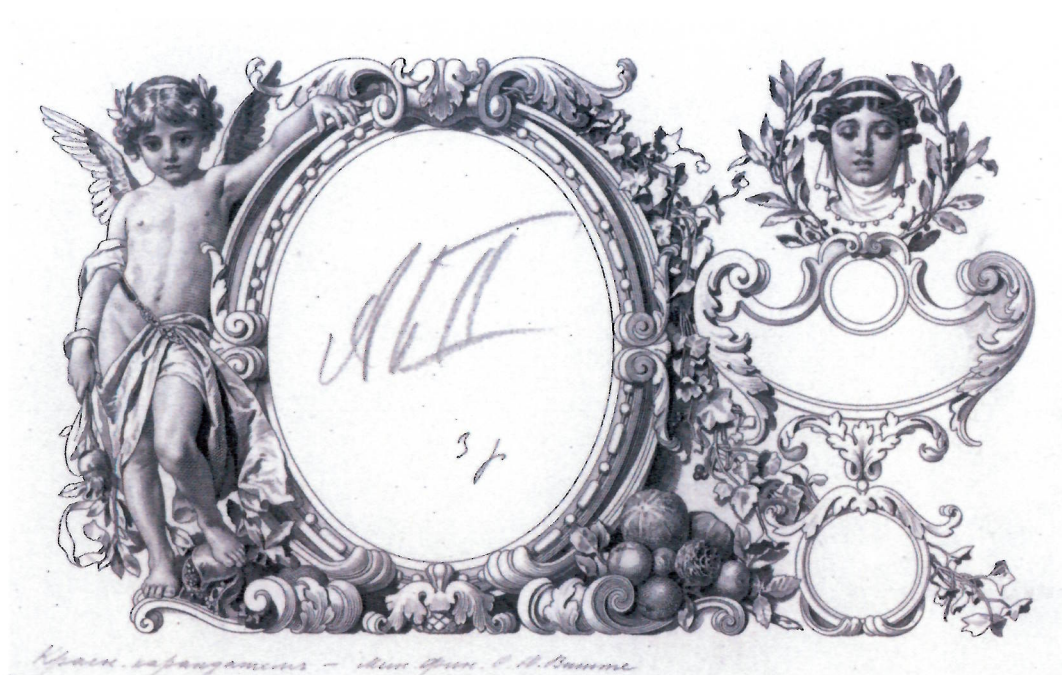
Рис. 2. Пробный оттиск неоконченной доски о. с. 3-рублевого билета по эскизу Р.И. Рёсслера с пометой С. Ю. Витте о смене портрета. Ок. 1897 г. (АО «Гознак»)