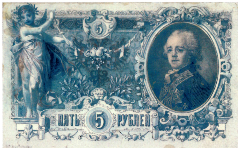
Р. И. Рёсслер. Эскизы л. и о. с. государственного кредитного билета достоинством 5 рублей. 1894 г. (АО «Гознак»). Уменьшено