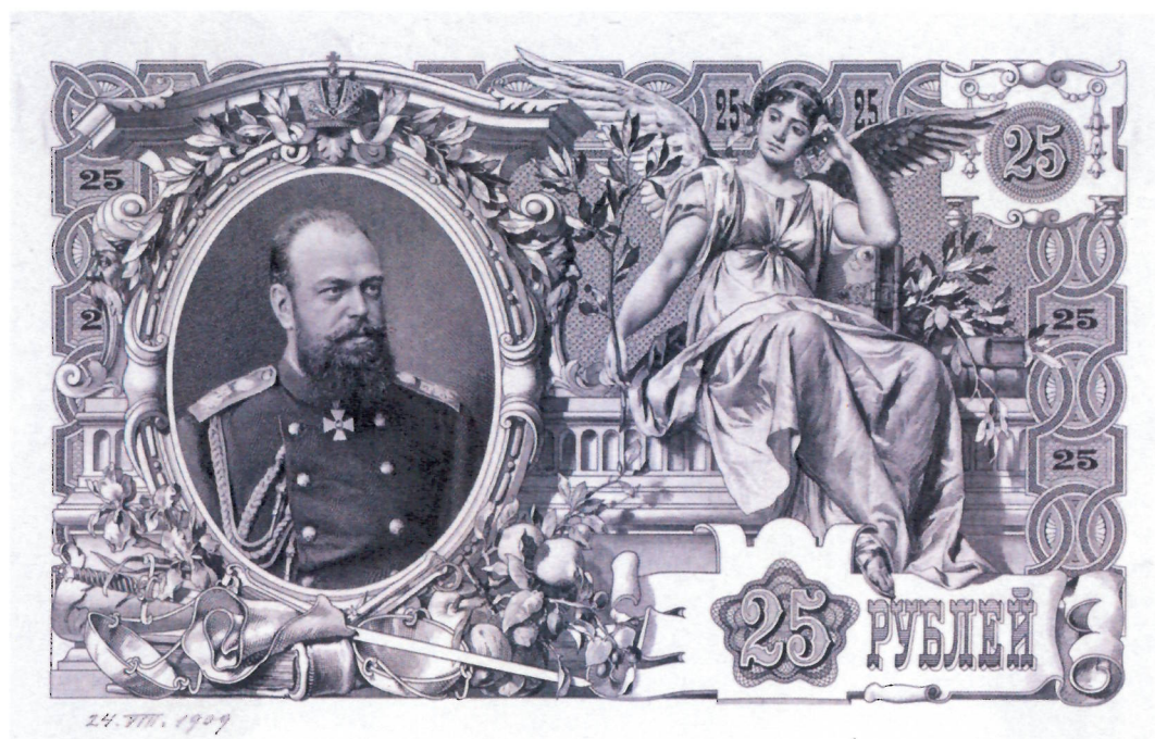
Рис. 3. Оттиск о. с. «забракованного» 25-рублевого билета по эскизу Р.И. Рёсслера. 1909 г. (АО «Гознак»)