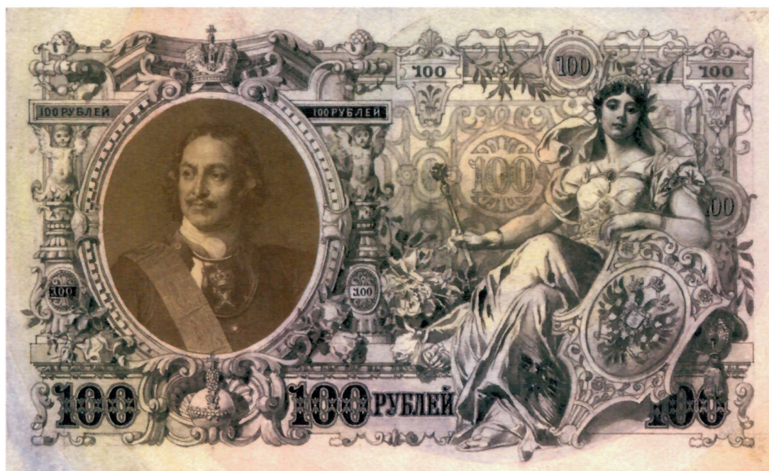
Р. И. Рёсслер. Эскизы л. и о. с. государственного кредитного билета достоинством 100 рублей. 1894 г. (АО «Гознак»). Уменьшено