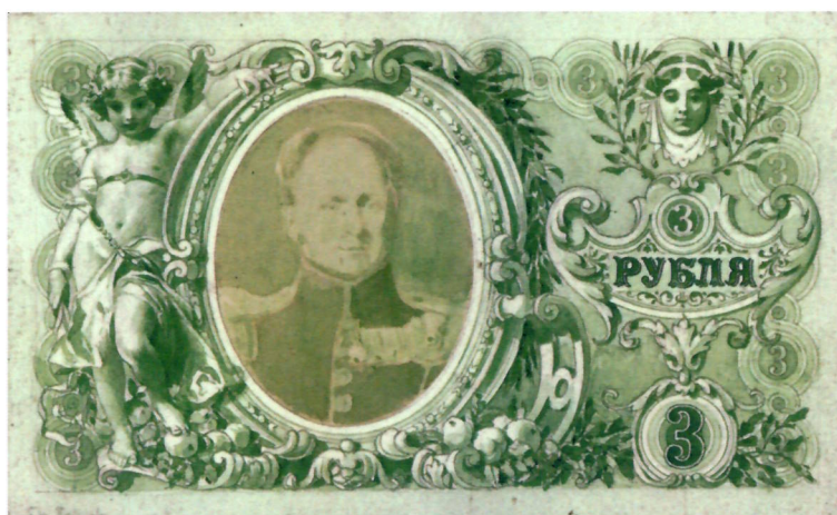
Р. И. Рёсслер. Эскизы л. и о. с. государственного кредитного билета достоинством 3 рубля. 1894 г. (АО «Гознак»). Уменьшено