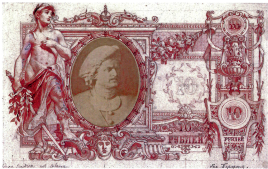
Р. И. Рёсслер. Эскизы л. и о. с. государственного кредитного билета достоинством 10 рублей. 1895 г. (АО «Гознак»). Уменьшено