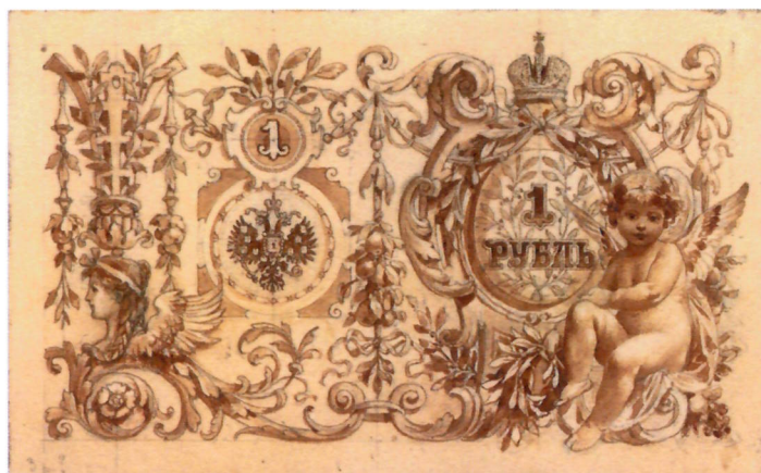
Р. И. Рёсслер. Эскизы л. и о. с. государственного кредитного билета достоинством 1 рубль. 1894 г. (АО «Гознак»). Уменьшено