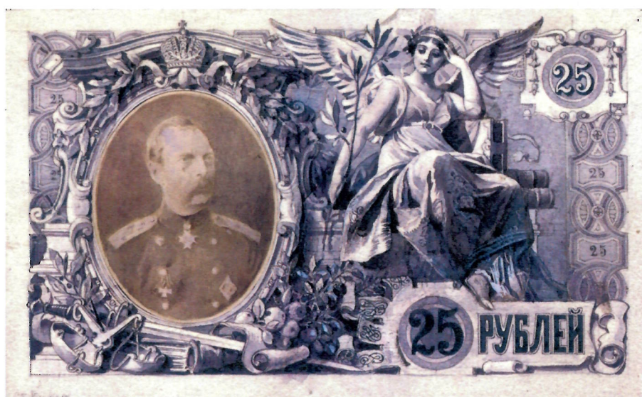
Р.И. Рёсслер. Эскизы л. и о. с. государственного кредитного билета достоинством 25 рублей. 1894 г. (АО «Гознак»). Уменьшено