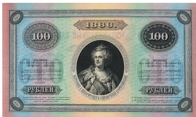
Рис. 41. Государственный кредитный билет образца 1866 г. достоинством 100 руб. Изображение уменьшено. ЕФОД. П.1-793.

вого билета, гравировка для которой была заказана позже) 48 . Однако печать новых кредитных билетов начата не была, поскольку Экспедиция не смогла найти граверов для выполнения досок для печати лицевых сторон, которые, согласно определению Комиссии для проектирования новых кредитных билетов, должны были готовиться в ЭЗГБ 49 .