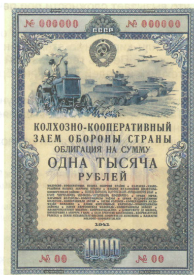
Эскизный проект облигации Колхозно-кооперативного займа обороны страны достоинством 1000 рублей. Художник И.И. Дубасов. Сентябрь 1941 г.

Андрей БОГДАНОВ Выставочный комплекс АО «Гознак»