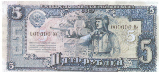
Эскизный проект лицевой стороны государственного казначейского билета достоинством 5 рублей. 1942–1943 гг.

чально предполагалось провести до окончания войны, а затем – после нее. На рубеже 1942–1943 годов художники Гознака создали первые эскизы пореформенных купюр. На них изображены летчики, краснофлотцы, танкисты. На многих проектах – портреты известных людей: ученых (И.П. Павлова, М.В. Ломоносова), революционеров (В.И. Ленина, Ф.Э. Дзержинского). Интересны эскизы серии банкнот с портретами полководцев – Александра Невского, Дмитрия Донского, А.В. Суворова, М.И. Кутузова. Однако для будущих пореформенных банкнот были выбраны эскизы с сугубо мирными сюжетами. В 1946–1947 годах новые советские бумажные деньги были отпечатаны и в декабре 1947 года вышли в обращение.