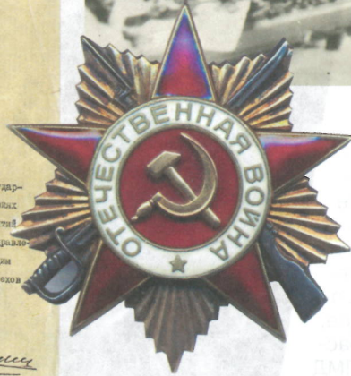
Орден Отечественной войны I степени. 1945 г.