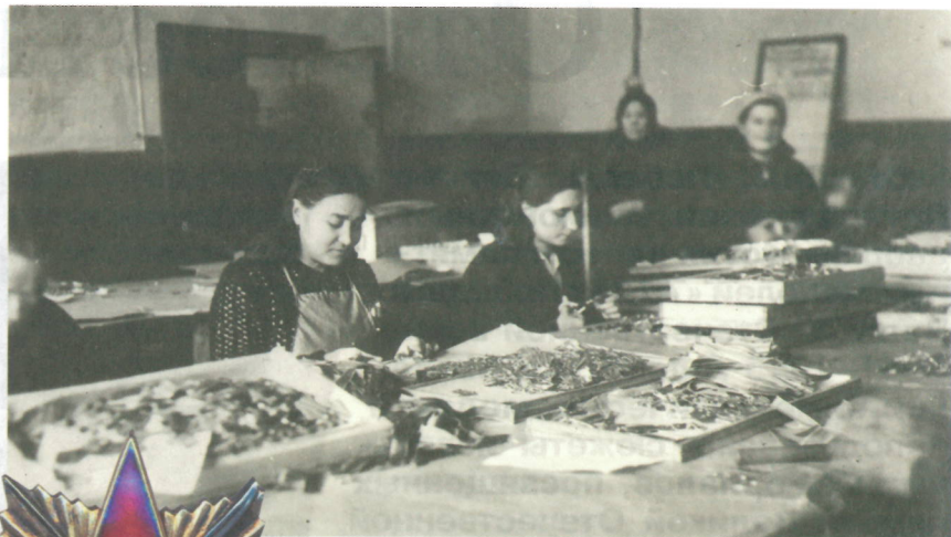
Изготовление медалей на Ленинградском монетном дворе. Крепление лент к колодкам. Около 1945 г.

Приветствие председателя Президиума Верховного Совета СССР М.И. Калинина, направленное сотрудникам Гознака по случаю его 125-летия. 1943 г.