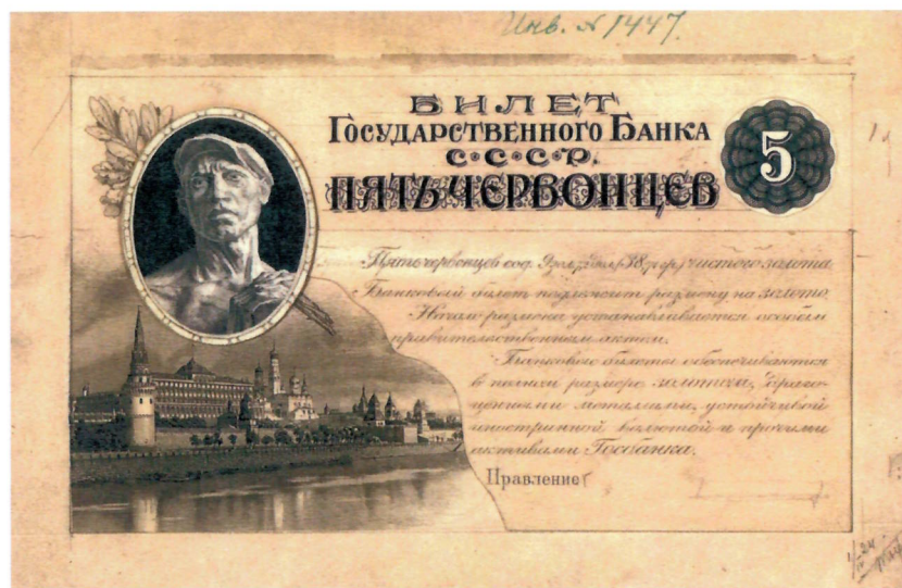
2. Эскиз билета Государственного банка СССР достоинством 5 червонцев. 1924 г. (АО «Гознак»). Уменьшено