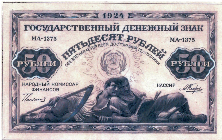
С. Я. Антонов. Эскизы государственных денежных знаков достоинством 5 и 50 рублей. [1923 г.] (АО «Гознак»). Уменьшено