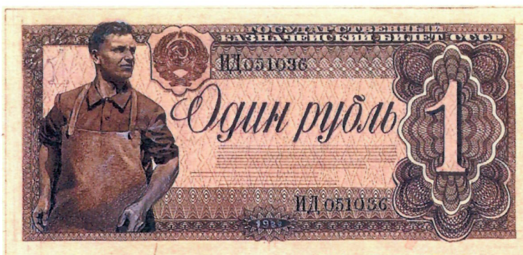
И. И. Дубасов. Эскизы государственных казначейских билетов СССР достоинством 1 рубль. 1936 г. (АО «Гознак»). Уменьшено