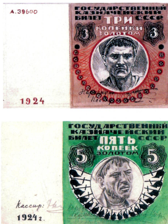
1. Я. Б. Дрейер. Эскизы государственных казначейских билетов СССР достоинством 3 и 5 копеек золотом. 1924 г. (АО «Гознак»). Уменьшено