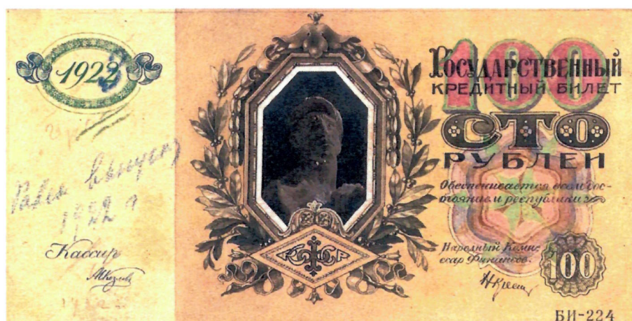
2. В. К. Куприянов. Эскиз государственного кредитного билета достоинством 100 рублей. 1922 г. (АО «Гознак»). Уменьшено