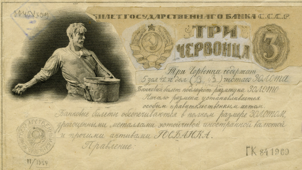
Я. Б. Дрейер. Эскизный проект билета Государственного банка СССР достоинством 3 червонца. 1923 г.