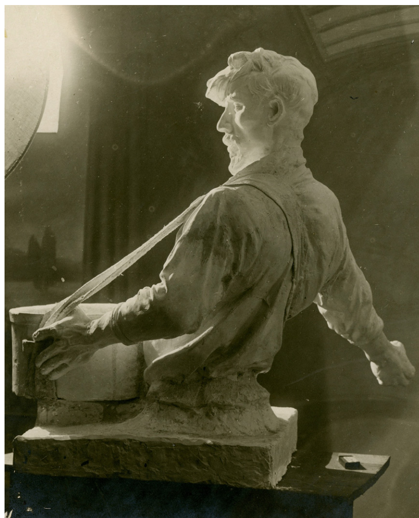
Фотографии скульптур И. Д. Шадра «Сеятель», сделанные в ходе работы над банкнотой. 1923 г.