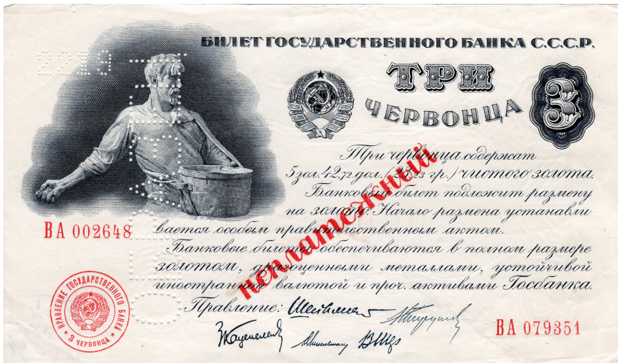
Билет Государственного банка СССР достоинством 3 червонца образца 1924 г. Образец