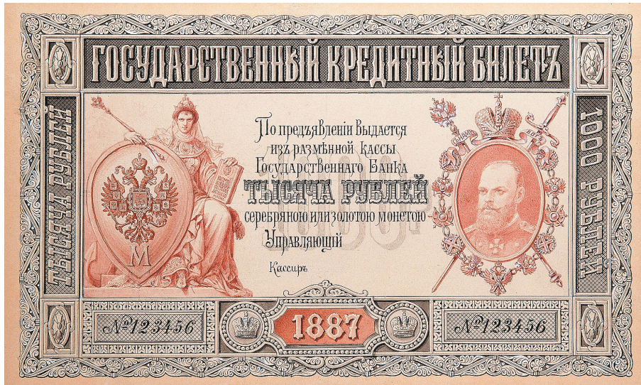
А.И. Шарлемань. Проектный рисунок билета достоинством 1000 рублей. 1887 г.