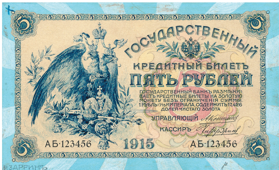
Р.Г. Заррин. Проектный рисунок билета достоинством 5 рублей. 1912 – 1914 гг.