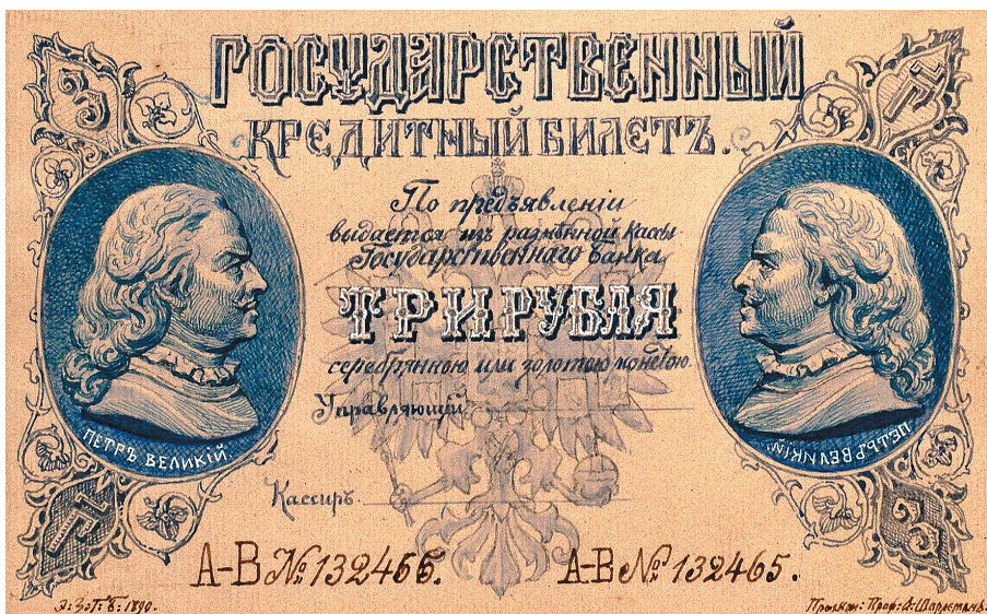
А.И. Шарлемань. Проектный рисунок билета достоинством 3 рубля. 1890 г.