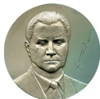
Международная премия имени академика В.П. Глушко «За пропаганду науки в литературе»