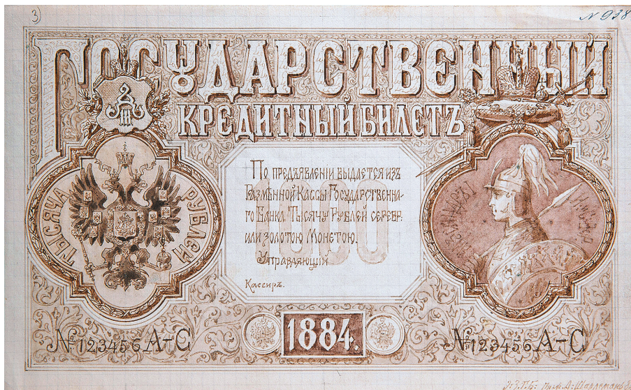
А.И. Шарлемань. Проектный рисунок билета достоинством 1000 рублей. 1884 г.

Взглянув на все выпущенные образцы российских банкнот второй половины XIX – начала