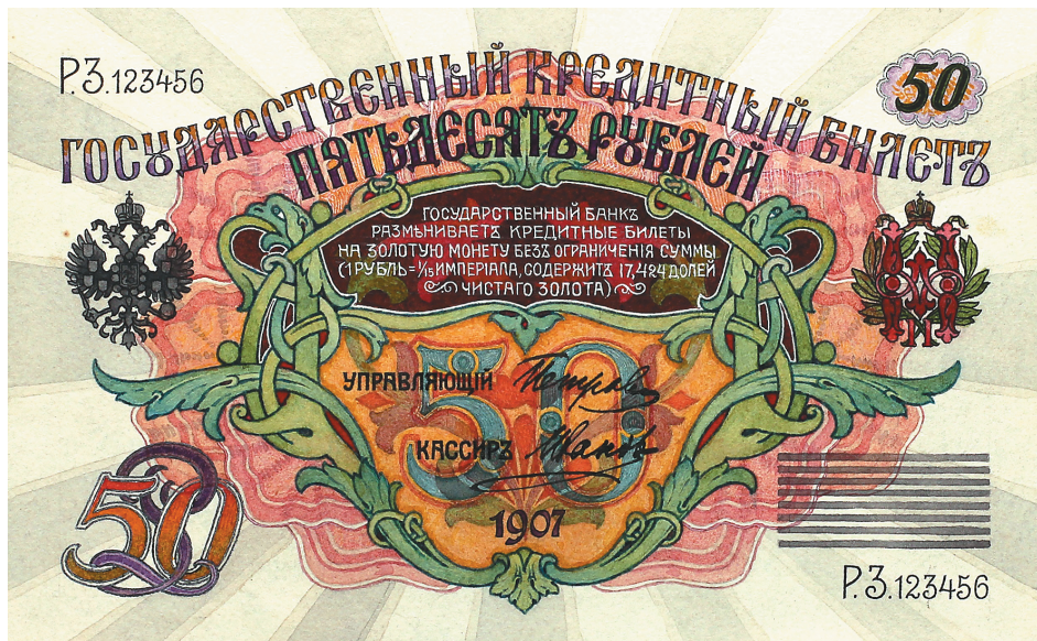
Р.Г. Заррин. Проектный рисунок билета достоинством 50 рублей. 1907 г.