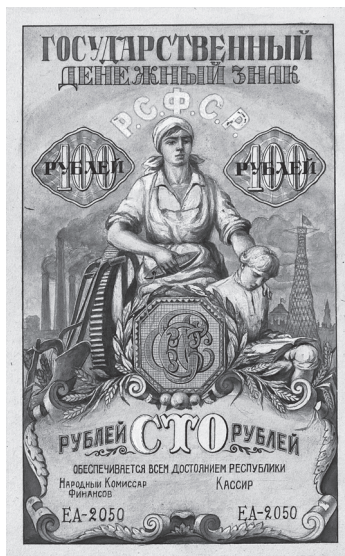
Рис. 5. Д.С. Галядкин. Неосуществленный проект денежного знака достоинством 100 рублей. 1923 г. (Собрание АО «Гознак»)

Образ крестьянки присутствует только на одном проекте — эскизе разменной бонны достоинством в 1 копейку золотом 1924 г. художника Я.Б. Дрейера (рис. 7). Этот проект составляет одну серию с двумя другими эскизами, на которых изображены рабочие (опубл.: Березина В.А., 2018. Цв. вкл. XVI).