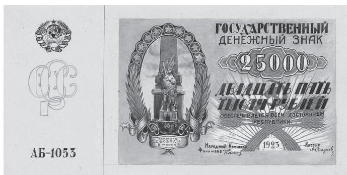
Рис. 3. Д.С. Галядкин. Проект денежного знака достоинством 25 000 рублей. 1923 г. (Собрание АО «Гознак»)