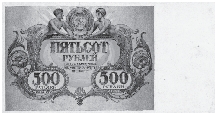
Рис. 1. Г.Г. Шмидт. Проект государственного кредитного билета достоинством 500 рублей. 1921/1922 г. (Собрание АО «Гознак»)