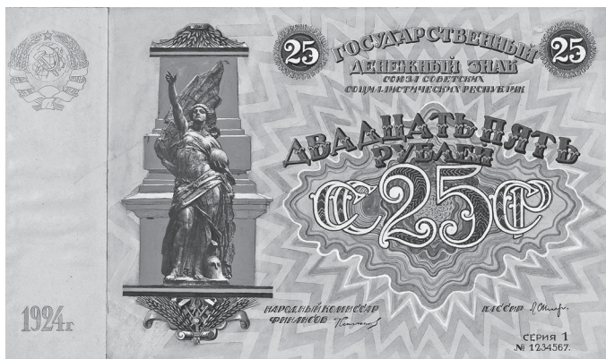
Рис. 4. А.Г. Якимченко. Проект денежного знака достоинством 25 рублей. 1924 г.

работы скульптора Н.А. Андреева. Изображение фрагмента обелиска со статуей Свободы художник Д.С. Галядкин поместил на проект денежного знака достоинством 25 000 рублей в 1923 г. (рис. 3), а художник А.Г. Якимченко на проект денежного знака достоинством 25 рублей в 1924 г. (рис. 4).