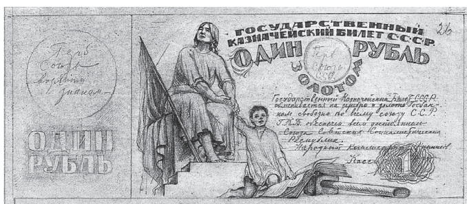
Рис. 2. Эскиз государственного казначейского билета СССР достоинством один рубль золотом. 1924 г.