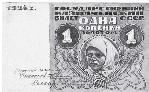
Рис. 7. Я.Б. Дрейер. Разменная бона достоинством в 1 копейку золотом. 1924 г. (Собрание АО «Гознак»)

Других проектных рисунков банкнот 1920-х гг. с изображениями женщин в собрании Гознака пока не выявлено. В 1936–1937 гг. разрабатывались проекты 5-рублевой банкноты с изображением женщины, но она так и не увидела свет, «уступив» место парашютисту (Березина В.А., 2017).