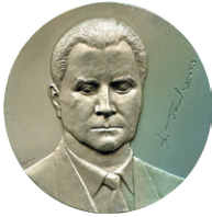
Международная премия имени академика В.П. Глушко «За пропаганду науки в литературе»