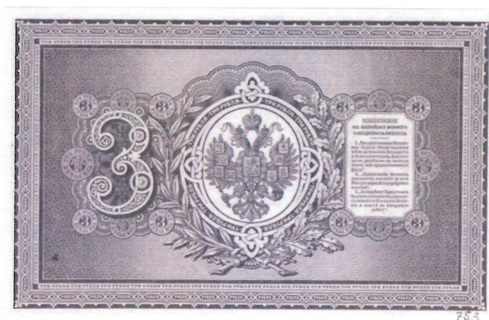
Рис. 1. Кредитный билет достоинством 3 рубля. Образец, утвержденный Александром III. 1887 г. Л. и о. с. ЕФОД. П. 1-753. Уменьшено

3, 5, 10 и 25 рублей (рис. 2), часть из которых датирована 1886 г. Рисунки Н. В. Набокова отличаются четкостью линий, наличием характерных геометрических фигур и узоров.