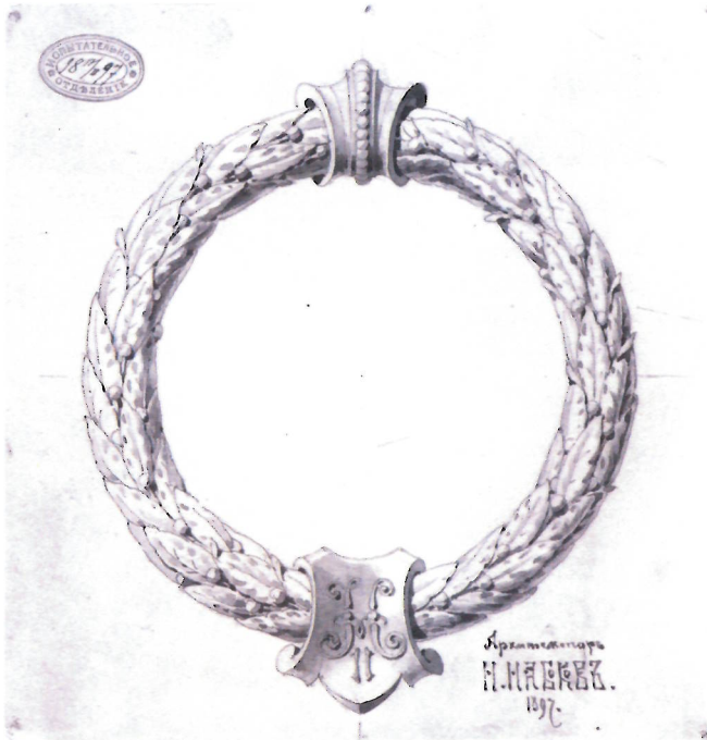
Рис. 3. Н. В. Набоков. Эскиз венка для кредитного билета достоинством 500 рублей. 1897 г. ЕФОД. П. 1 г-1764/17. Уменьшено

В собрании Гознака представлены многочисленные виньетки, выполненные художником 19 .