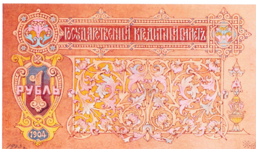
2. Н. В. Набоков. Эскиз подложечной сетки (?) л. с. кредитного билета достоинством 1 рубль. 1903 г. ЕФОД, П. 1 г-1767/51. Уменьшено