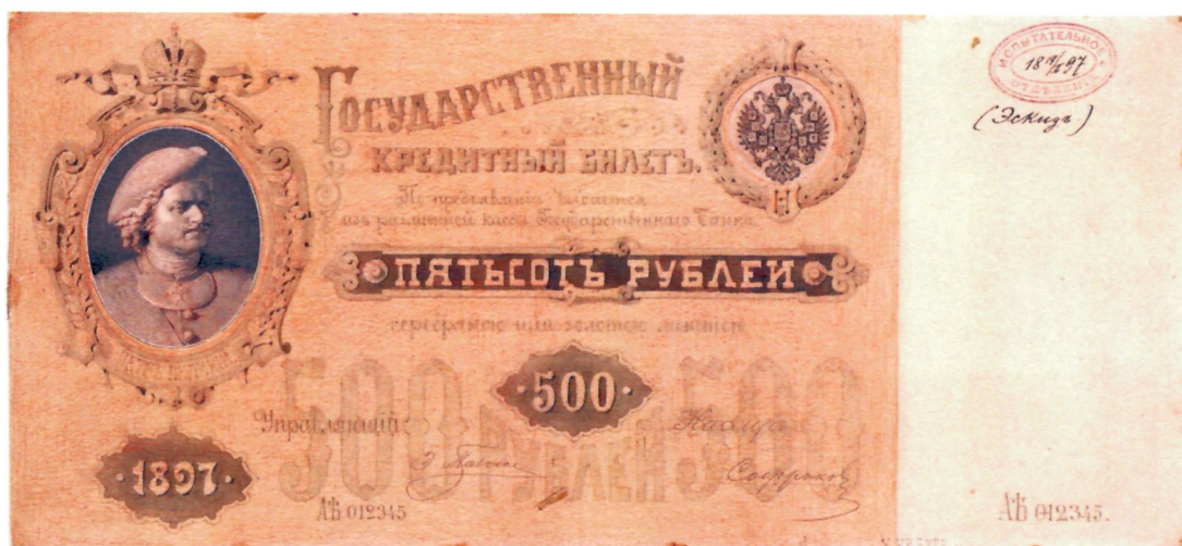
1. Н. В. Набоков. Эскиз л. с. кредитного билета достоинством 500 рублей. 1897 г. ЕФОД, П. 1 г-1764/34. Уменьшено