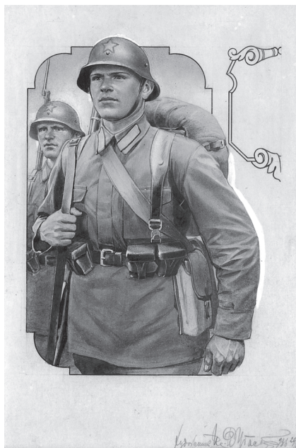
Рис. 7. Окончательный вариант изображения красноармейца. Рисунок И. И. Дубасова. 29 июля 1936 г.

ма советской разработки. Шлем был заменен, и вместе с ним заменили патронные сумки — тогда же в РККА появилась новая, двухсекционная, внешне сильно отличавшаяся от предыдущей. Окончательный рисунок был сделан Дубасовым 29 июля 1936 г. (рис. 7. ФХ. П.1г-1809), а эскиз банкноты утвержден народным комиссаром финансов Г.Ф. Гринько 8 октября 1936 г. (ФХ. П.1а-980) Таким образом, все работы по «переделке» бойцов заняли немногим меньше двух месяцев.