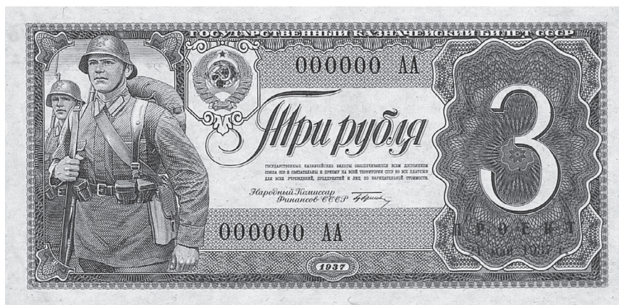
Рис. 8. Пробный оттиск трехрублевого билета с факсимильной подписью наркома финансов СССР Г. Ф. Гринько. 21 мая 1937 г.

И.И. Дубасов стал «жертвой» масштабного переоснащения РККА, которое началось как раз в 1935–1936 гг. Эскизы «не поспевали» за изменениями, но с политической точки зрения было важно показать бойца в новейшей форме. Как раз в это время впервые после Гражданской войны в СССР было обращено пристальное внимание на модернизацию снаряжения пехотинца, причем это снаряжение старались сделать не только удобным, но и не менее красивым, чем у вероятного противника — немецкой, польской и японской армий.