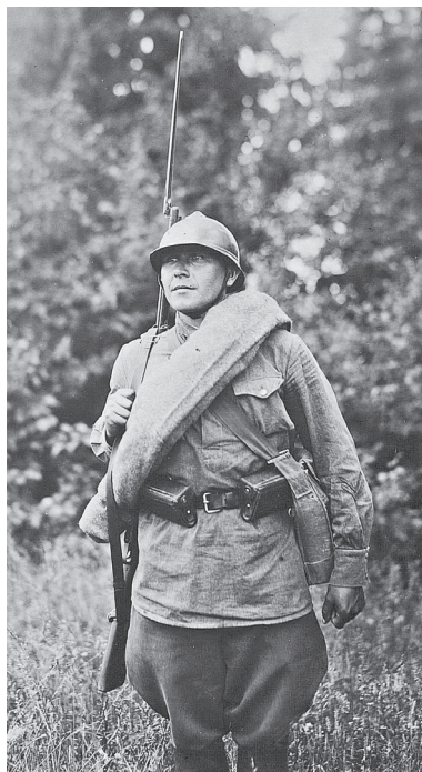
Рис. 4. Фотография красноармейца со скаткой. 1936 г.

отправлен в воинскую часть для того, чтобы сфотографировать красноармейцев в походной форме и переделать эскиз. Возможно, тогда и выяснилось, что красноармеец на первом эскизе не только имеет слишком грозное лицо, но и одет не по форме. Вскоре были сделаны снимки, и художник на их основе продолжил работу.