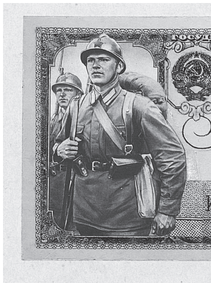
Рис. 6. Фрагмент фотокопии рисунка И. И. Дубасова с изображением красноармейца с ранцем. 1936 г.

ма советской разработки. Шлем был заменен, и вместе с ним заменили патронные сумки — тогда же в РККА появилась новая, двухсекционная, внешне сильно отличавшаяся от предыдущей. Окончательный рисунок был сделан Дубасовым 29 июля 1936 г. (рис. 7. ФХ. П.1г-1809), а эскиз банкноты утвержден народным комиссаром финансов Г.Ф. Гринько 8 октября 1936 г. (ФХ. П.1а-980) Таким образом, все работы по «переделке» бойцов заняли немногим меньше двух месяцев.