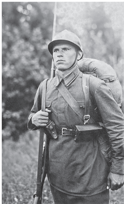
Рис. 3. Фотография красноармейца, ставшего прототипом изображения на трехрублевом билете. 1936 г.