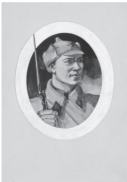
Рис. 1. Рисунок красноармейца для трехрублевого билета, выполненный С. А. Поманским. 1936 г

основой для итогового варианта. На этих рисунках бросается в глаза разнообразие вариантов обмундирования и снаряжения бойцов. Попробуем разобраться в них и понять причины и хронологию их появления и изменения.