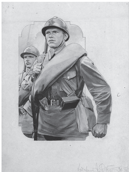
Рис. 5. Рисунок красноармейца со скаткой, сделанный И. И. Дубасовым на основе фотографий. 15 июня 1936 г.