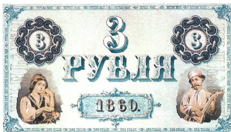
4. А. И. Дютак. Эскиз л. и о. с. кредитного билета достоинством 3 рубля (без паспарту). 1860 г. ЕФОД. П. 1 г-1760/3, 17. Уменьшено