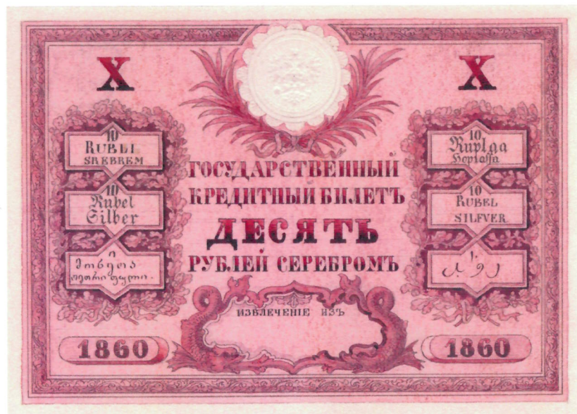
2. Н. А. Заурвейд, А. А. Фаддеев. Эскиз л. и о. с. кредитного билета достоинством 10 рублей. 1859 г. ЕФОД, П. 1 г-1760/23, 71. Уменьшено