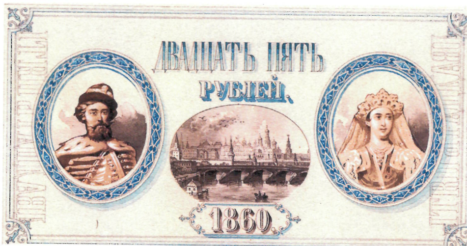
5. А. И. Дютак. Эскиз л. и о. с. кредитного билета достоинством 25 рублей (без паспарту). 1860 г. ЕФОД. П. 1 г-1762/36, П. 1 г-1760/20. Уменьшено