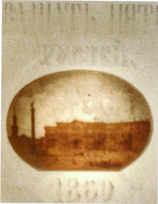
6. Фрагмент эскиза о. с. кредитного билета достоинством 25 рублей. 1860 г. Снимок на просвет. ЕФОД. П. 1 г-1760/20. Увеличено