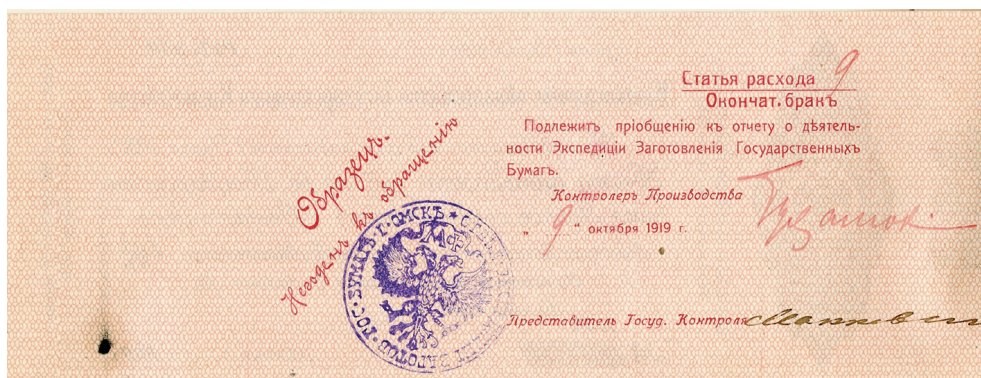
Реверсы образцов «сибирских» краткосрочных обязательств Государственного казначейства номиналами 100 и 250 руб. Фрагмент «Краткого отчета...»

Отсутствие в перечисленном ряду 300-рублевого казначейского знака объясняется тем, что его разработали и утвердили позже даты составления отчета. Выпуск данной купюры в обращение состоялся в конце ноября 1919 г. в Иркутске в период эвакуации Российского правительства А. В. Колчака 9 .