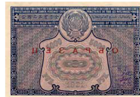
Расчетный знак обычного образца

номики необходимо ликвидировать денежный хаос. В 1922 году в РСФСР была проведена деноминация, в ходе которой старые деньги были обменены на новые в соотношении 1 к 10000. Начало подготовки к деноминации совпало с разработкой новых упрощенных расчетных знаков. Теперь печатать и выпускать их в обращение смысла не было. Поэтому они сохранились только в образцах из собрания Гознака, оставшись памятниками тяжелого периода в истории экономики нашей страны.