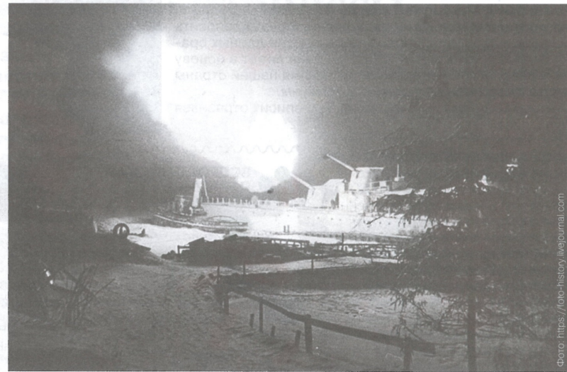
Эскадренный миноносец Краснознаменного Балтийского флота «Стойкий» ведет обстрел гитлеровских позиций. Ленинград. 1943 г.

мажной фабрики в Ленинграде в их производство был важной частью выполнения военного заказа со стороны Гознака.