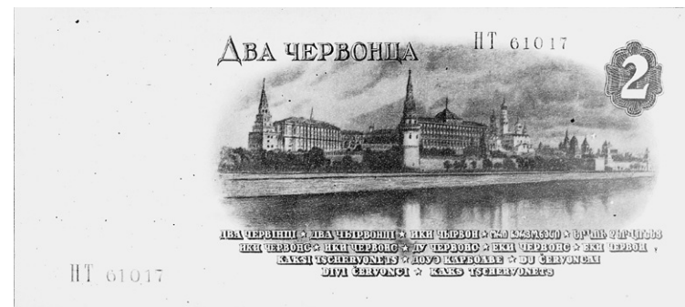
Рис. 6. Н. Терморуков (?). Эскизный проект о.с. билета Государственного банка СССР номиналом 2 червонца с портретом Я.М. Свердлова. Вариант 2. Фотокопия. 1940 г. ЕФОД. Уменьшено

Эскизные проекты этой купюры, выполненные, вероятно, художником Н. Терморуковым, известны в двух вариантах. На одном из них (ЕФОД. П.1а-1820) рисунок, повторяющий гравюру Ксидиаса. Однако в него внесены изменения: уровень воды в реке выше (как известно, в 1930-х гг. был реализован план обводнения Москвы); убран тоннель на месте старого русла реки Неглинной — возможно, чтобы не было нежелательных ассоциаций про «подкоп под Кремль». При этом постройки Кремля, снесенные в 1930-е гг. (в частности, церковь Благовещения на Житном дворе) оставлены. На другом варианте эскиза (ЕФОД. П.1а-1828/2) — вид Кремлевской стены и Большого Кремлевского дворца. Это — фотография, наклеенная на эскиз.