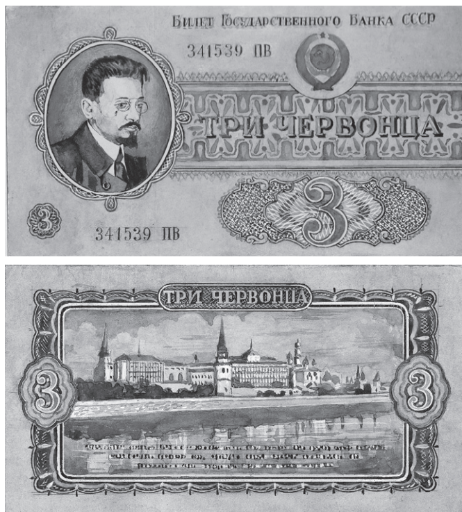
Рис. 7. Эскизный проект билета Государственного банка СССР номиналом 3 червонца. 1942–1943 гг. ЕФОД. Уменьшено

В начале 1943 г. художник И.И. Дубасов выполнил новые эскизы будущих банкнот номиналом 10, 25, 50 и 100 рублей, часть из которых была утверждена. Среди них — эскизный проект билета