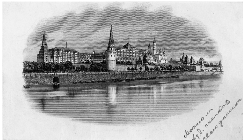
Рис. 4. Пробный оттиск оригинальной формы с видом Кремля. 1923 г. ЕФОД. Уменьшено

подпись художника, выполненная справа внизу миниатюрными буквами. На оттиске, помещенном в Отчете Технического отдела ее еще нет, но есть помета «Можно ли худ[ожнику] поставить свою фамилию» (рис. 4). Вероятно, этот вопрос решился положительно, однако отметим, что практики ставить подпись гравера на металлографские формы, предназначенные для денежных знаков, ни в ЭЗГБ, ни в Гознаке, до этого не было.