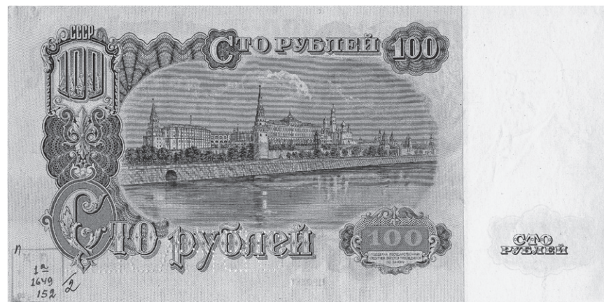
Рис. 10. Печатный проект билета Государственного банка СССР номиналом 100 рублей. 1945 г. ЕФОД. Уменьшено

100-рублевки И.И. Дубасов выполнил новые эскизные проекты с измененным номиналом. Затем были переделаны клише и сделаны новые печатные проекты в разных расцветках. Однако новым червонцам так и не суждено было появиться. На печатных проектах билета достоинством 10 червонцев И.В. Сталин собственноручно заменил обозначение номинала на «100 рублей» (ЕФОД. П.1а-1813/1–2). Клише были опять переделаны, и подготовлены новые печатные проекты. Наконец, 8 июля 1946 г. Сталин санкционировал последнее изменение на банкнотах государственного герба СССР — теперь в нем стало не 11, а 16 лент ( Денежная реформа , 2010. С. 195). Затем был от-