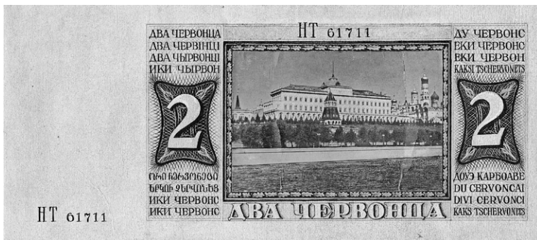
Рис. 5. Н. Терморуков (?). Эскизный проект билета Государственного банка СССР номиналом 2 червонца с портретом Я.М. Свердлова. Вариант 1. 1940 г. ЕФОД. Уменьшено