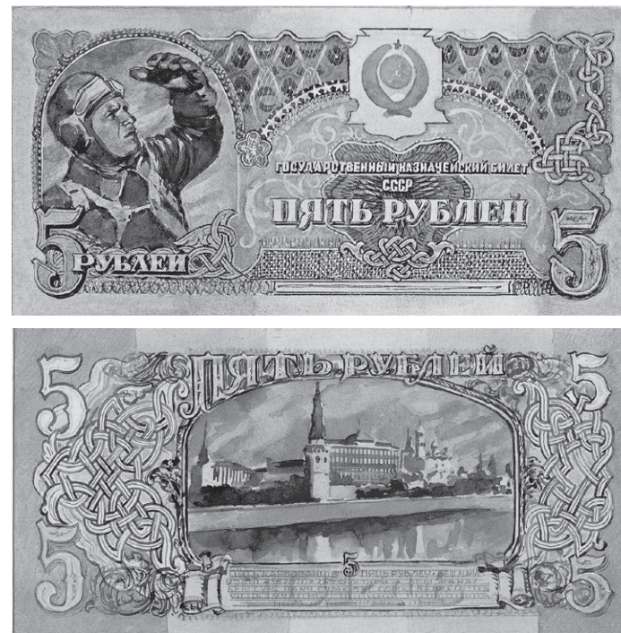
Рис. 8. И.И. Дубасов. Эскизный проект государственного казначейского билета СССР номиналом 5 рублей. 1942–1943 гг. ЕФОД. Уменьшено

Государственного банка СССР достоинством 100 рублей, законченный 12 марта 1943 г. (ЕФОД. П.1а-1797/5–6, рис. 9). На о.с. — вид Кремля, повторяющий гравюру 1923 г. с небольшими изменениями (поднят уровень воды и убран тоннель). Проект о.с. был утвержден, но до окончания войны денежная реформа проведена не была, и новые банкноты отпечатаны не были. В течение 1944–1945 гг. велась работа по подготовке реформы, рассматривались и обсуждались ее варианты. В апреле 1945 г. на основе эскизов И.И. Дубасова были начаты работы по созданию печатных проектов банкнот крупных достоинств. В итоге были созданы печатные проекты 100-рублевой купюры с портретом В.И. Ленина на лицевой стороне и видом Кремля на оборотной. На них обозначен 1946 год, дано название «государственный кредитный билет СССР» и указание на то, что они «обеспечиваются всем достоянием Союза ССР»; изображен герб СССР с 11 лентами, но тексты даны на 16 языках союзных республик. Купон с локальным водяным знаком расположен