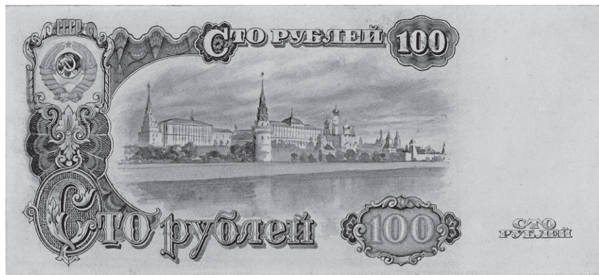
Рис. 9. И.И. Дубасов. Эскизный проект билета Государственного банка СССР номиналом 100 рублей. 1943 г. ЕФОД. Уменьшено

слева (рис. 10). Вид Кремля был награвирован заново: с него «убрали» церковь Благовещения на Житном дворе, добавили звезды, венчающие башни. Тоннель на месте старого русла реки Неглинной был «убран» в процессе работы — известны оттиски как с ним, так и без него.