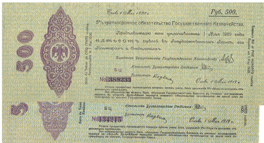
Рис. 5. Боны Вида серии XX, Тип ДД-Е 500 р. серия БЦ (одного цвета с картушем) № 389233, знак № – «Маленький», Длинная Фальшивая 500 р. серия БЦ (чёрного цвета) № 134215

« Сибирские » краткосрочные обязательства Государственного казначейства номиналом 500 рублей печатались на бумаге без водяных знаков, бумага использовалась по качеству самая разная: толстая рыхловатая, плотная лощёная.