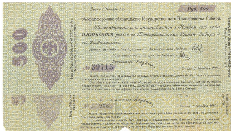
Рис. 1. Боны КОГКС (Казначейства Сибири): № 39715 Без серии, Ноябрь 1918 г. – вариант заглавная «Н» «украшенная» № 908 серия Б одного цвета с картушем, Ноябрь 1918 г. – вариант заглавная «Н» «украшенная»