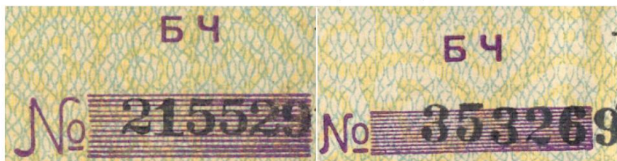
Рис. 6. Тип ДД-Е – варианты знака №: «Большой» и «Маленький» – серия БЧ

Цвет фона лицевой стороны на бонах – оттенки зелёного с очень большой вариацией, могут быть боны с цветом фона от очень светлого до совсем тёмного. Фоновый цвет формируется узорной защитной сеткой, а под ней всегда есть фоновый рисунок « большие цветы » нанесённый оттенками жёлтого – он хорошо виден на Рис. 4. на боне 500 ББ № 26262 , а на боне 500 БЦ №389233 на Рис. 5. он практически не виден. Защитная сетка на оборотной стороне бон приведена на Рис. 3. Только на бонах КОГКС на оборотной стороне может встречаться дополнительно отпечатанная цифра « 2 ».