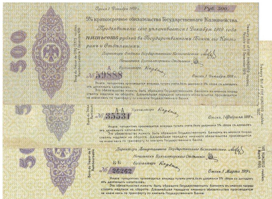
Рис. 4. Начальные серии для трёх Видов серии: А 59888 – Вид серии X , Тип ДО-Ко -, литера серии « А » одного цвета с картушем, Короткая А-А 35531 – Вид серии X-X , Тип ДО-Кх , литеры серии « А-А » чёрного цвета, Длинная ББ 26262 – Вид серии XX , Тип ДД-Кх , литеры серии « ББ » чёрного цвета, Длинная

Наряду с Омском большой объём бумажно-денежной массы производило отделение Экспедиции заготовки государственных бумаг, расположенное в Екатеринбурге, дававшее до 70% новых крупных купюр 10 . Екатеринбургским отделением Экспедиции заготовки государственных бумаг за весь период его работы печатались только краткосрочные обязательства Государственного казначейства, причём, с момента открытия отделения и до марта 1919 г. изготавливались исключительно тысячерублёвые купюры. Впоследствии было организовано производство банкнот и других номиналов – 25, 250 и 500 руб. Печатание «сибирских» денежных знаков в Екатеринбурге продолжалось вплоть до начала июля 1919 г. Производство было прекращено в связи с эвакуацией антибольшевистских сил из Екатеринбурга на восток. В разных источниках есть две даты прекращения печатания «сибирских» денег в Екатеринбурге: 4 и 7 июля 1919 г. 11 . А уже